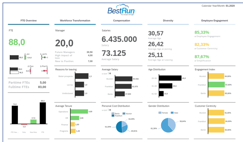
Beispiel Dashboard HR Analytics dargestellt mit SAP Analytics Cloud