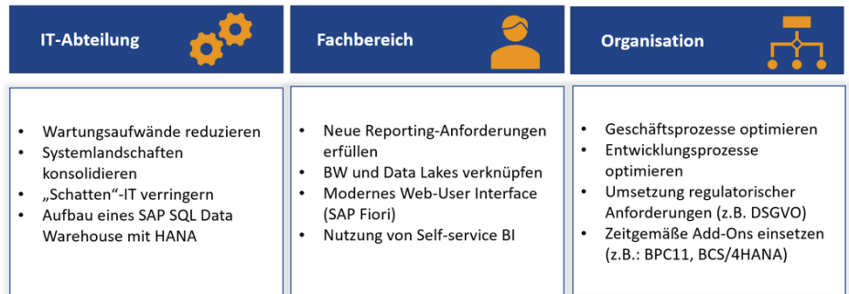
Abbildung: Motivationen für eine SAP BW/4HANA-Migration

Die daraus abzuleitenden Ziele und Empfehlungen für die Migration zu erkennen und Handlungsempfehlungen daraus abzuleiten ist nur einer der Schwerpunkte des Workshops.