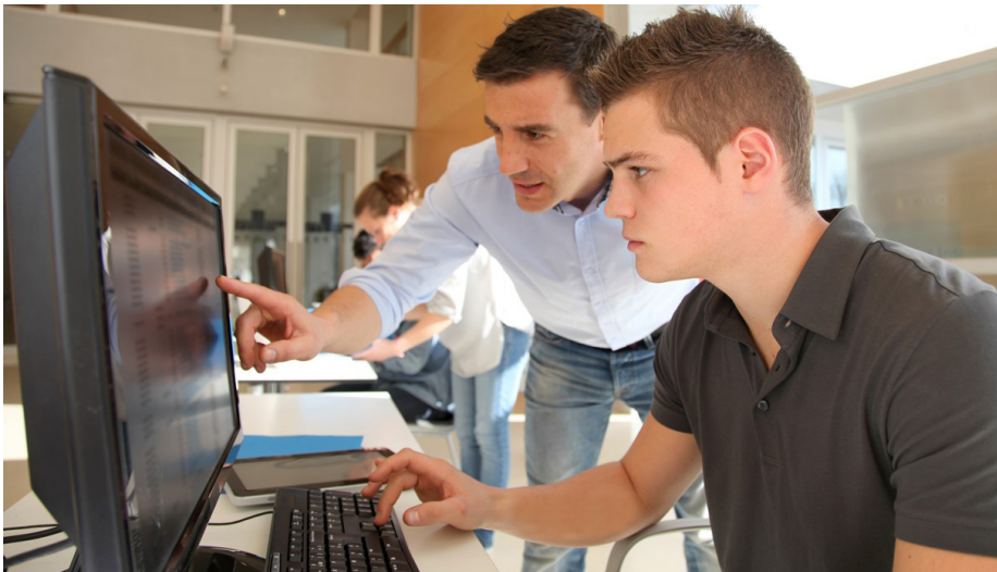
Abbildung: Workshop für die IT – remote oder on-site

Dieser Workshop soll den IT-Verantwortlichen in Ihrem Unternehmen alle relevanten Konzepte und Tools in SAP S/4HANA so vermitteln, dass das Potenzial für ein aussagefähiges Analytics zielgerichtet in der Organisation genutzt werden kann.