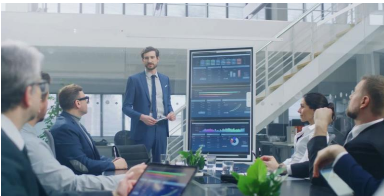
Abbildung: Wir schulen Ihr Team vor Ort oder per Video-Konferenz

Diese CubeServ-Schulung zu SAP BW/4HANA bietet die richtige Grundlage für alle Entwickler und BI-Leiter mit technischem Fokus, das zugrundeliegende Toolset in SAP BW/4HANA zu begreifen und für Unternehmensprozesse zielführend und ressourcenoptimiert einzusetzen. Dabei werden sowohl die theoretischen Konzepte erläutert als auch zu mindestens 50 % praktische Übungen am System bearbeitet, um reale Anwendungsfälle zu erlernen.