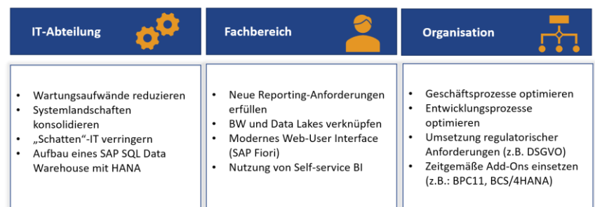
Abbildung: Motivationen für eine SAP BW/4HANA-Migration

Die daraus abzuleitenden Ziele und Empfehlungen für die Migration zu erkennen und Handlungsempfehlungen daraus abzuleiten ist nur einer der Schwerpunkte des Workshops.